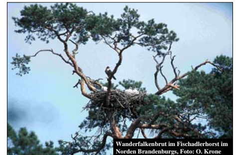
Wanderfalkenbrut im Fischadlerhorst im Norden Brandenburgs, Foto: O. Krone

Das Projekt wird allen IUCN-Kriterien für Wiederansiedlungsprojekte gerecht.