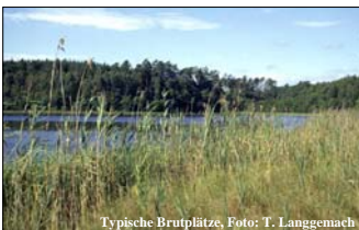
Typische Brutplätze, Foto: T. Langgemach