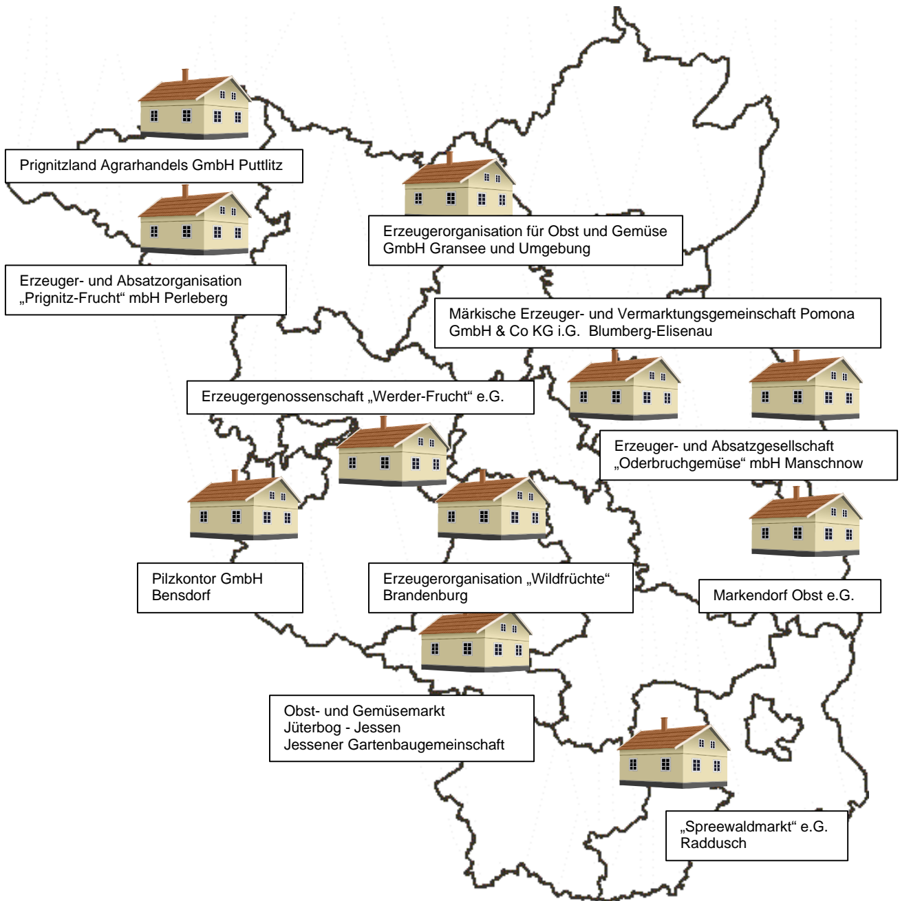
Abbildung 1: Anerkannte Erzeugerorganisationen für Obst und Gemüse im Land Brandenburg, Stand Januar 1995

Dieser Umstand ist nicht primär auf das Wirken der Erzeugerorganisationen, sondern auf wirtschaftliche Schwierigkeiten in den Erzeugerbetrieben, die sich im Prozess der Anpassung ihrer Sortimente an veränderte Nachfragestrukturen befanden, zurückzuführen. Mit fortschreitender Sortenbereinigung durch die Rodung schwer oder nichtmarktgängiger Sorten (z.B. Gloster) sank zeitgleich der Anteil der Interventionsware. Im Unterschied zum Obstbau spielte das Instrument der Intervention im Gemüsebau kaum eine Rolle.