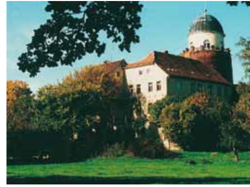
Auf der Burg Lenzen betreibt der BUND das Europäische Zentrum für Auenökologie, Umweltbildung und Besucherinformation. Die Dauerausstellung „Mensch und Strom“ ist hier zu sehen.

„Qualmwasser“ füllt hinter Deichen vorübergehend Mulden und Senken. Diesen Lebensraum auf Zeit haben sich einige spezialisierte Tiergruppen wie z. B. die Rotbauchunke erobert.