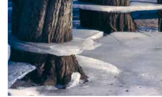
Auwälder gehören zu den seltensten Waldgesellschaften Mitteleuropas.