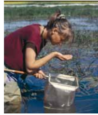
Das wissenschaftliche Interesse an der naturnahen Flussauenlandschaft und der historisch gewachsenen Kulturlandschaft am Strom ist groß. Jährlich entstehen bis zu 30 wissenschaftliche Arbeiten im Biosphärenreservat.