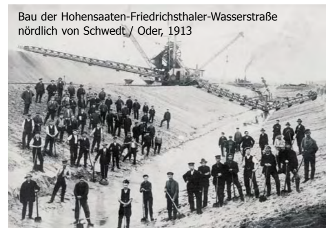
Bau der Hohensaaten-Friedrichsthaler-Wasserstraße nördlich von Schwedt / Oder, 1913

Die über viele Jahre von ehrenamtlichen Ornithologen gesammelten Daten zur Vogelwelt führten bereits 1980 zur Ausweisung ausgedehnter Polderflächen als Feuchtgebiet von internationaler Bedeutung (FIB). 1992 vereinbarten Polen und Deutschland die Schaffung des grenzüberschreitenden Schutzgebietes „Internationalpark Unteres Odertal“, um den auch im europä-