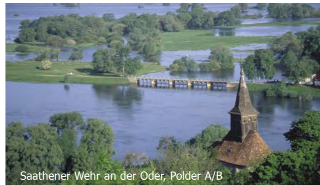
Saathener Wehr an der Oder, Polder A/B

ischen Maßstab einzigartigen Landschaftsraum zu erhalten. Im Juni 1995 wurde schließlich das Gesetz zur Errichtung des Nationalparks Unteres Odertal vom Brandenburgischen Landtag beschlossen, welches 2006 novelliert wurde.