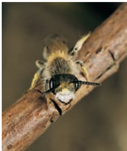
Männchen der Sandbiene Andrena ventralis