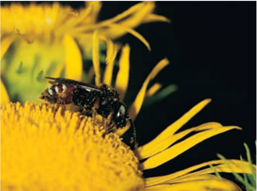
Weibchen der Schmuckbiene Epeoloides coecutiens