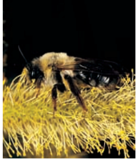
Weibchen der Sandbiene Andrena vaga