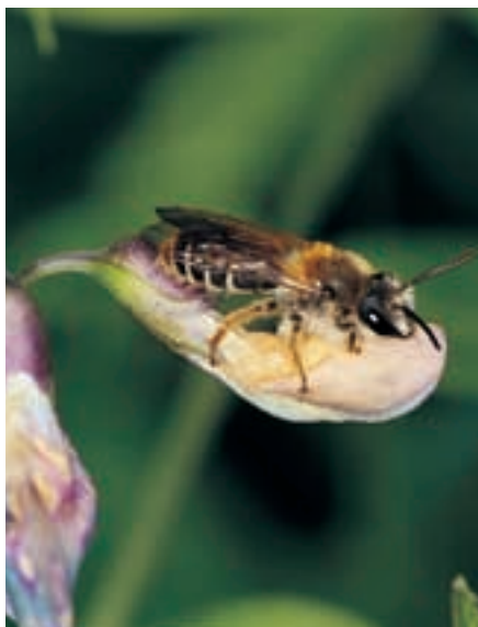
Männchen der Sandbiene Andrena lathyri