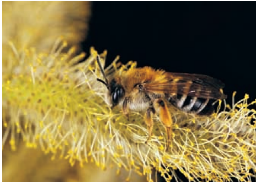
Weibchen der Sandbiene Andrena gravida