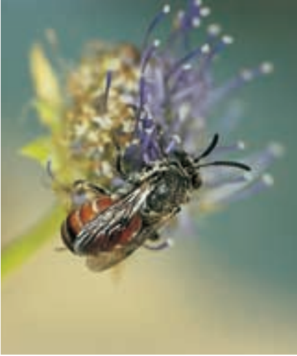
Weibchen der Sandgängerbiene Ammobates punctatus