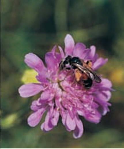
Weibchen der Sandbiene Andrena hattorfiana