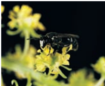
Männchen der Maskenbiene Hylaeus signatus