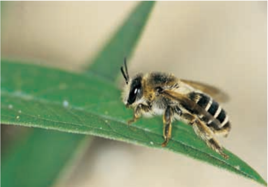
Weibchen der Sägehornbiene Melitta nigricans