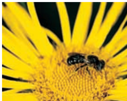
Männchen der leere Schneckenhäuser bewohnenden Mauerbiene Osmia spinulosa