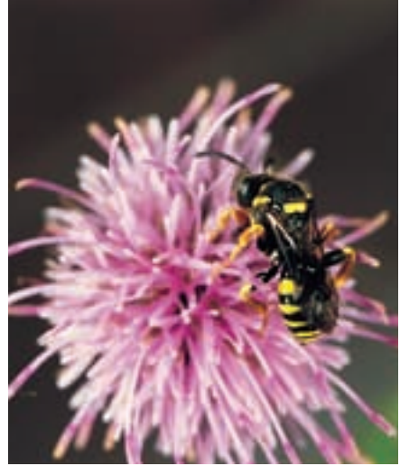
Weibchen der Wespenbiene Nomada rufipes