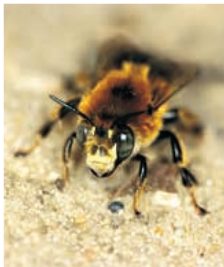
Männchen der Pelzbiene Anthophora retusa