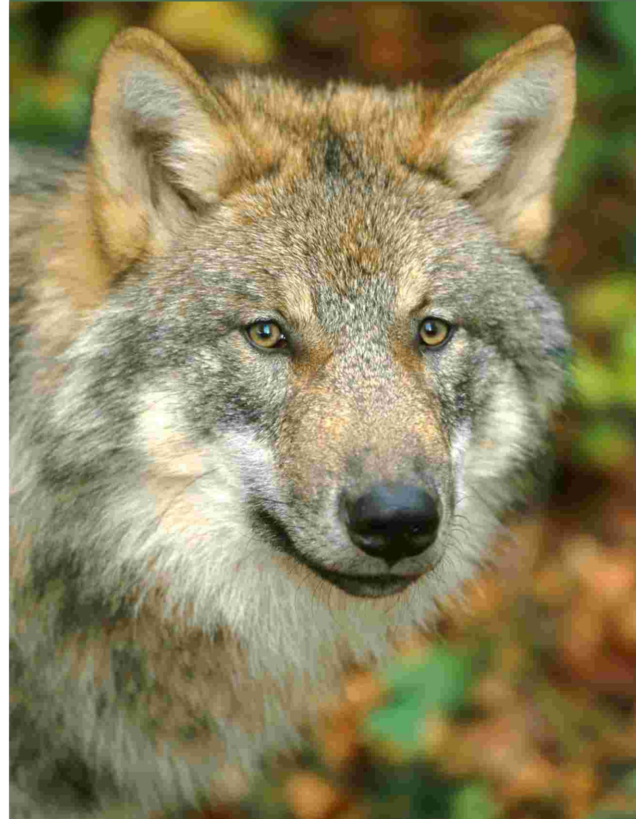
Porträt des Europäischen Grauwolfs