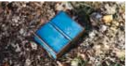
Eingelassen in Feldstein und Erdreich begleiten blau leuchtende Keramiksteine wie eine Spur den Wanderpfad. Nach einem beschaulichen Blick auf den See durch „Das kleine ...“ und „Das große Fenster“ gipfelt die Spurensuche am Ende der gepflegten Uferpromenade im „Blauen Wunder“. Halb Mauer, halb Bank schiebt sich das Objekt der Berliner Künstlerin Inge Knote in den Weg des Promenierenden, will Blickfang sein und lädt zum Verweilen am Badestrand ein.