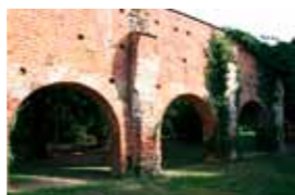
Die Überreste der ehemaligen Klosteranlage mit Kirchenruine, Mauerfragmenten und Brauhaus spiegeln in ihrer schlichten Schönheit die Bescheidenheit der Lebensweise und das Armutsideal im klösterlichen Refugium. Erinnerungen an das spezialisierte Wissen der Ordensbrüder um die Heilkräfte der Natur werden im Kräutergarten lebendig.

Ungewöhnlich ist der achteckige Baukörper der Kirche im gotischen Stil. Unter dem mit einem Türmchen gekrönten Dach der „Kirche am Wege“ gestaltet ein Förderverein ein umfangreiches Kulturprogramm.