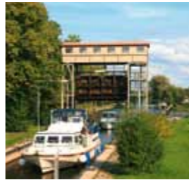
Imposant ragen die großen Hubtore der Bredereicher Havel Schleuse in den märkischen Himmel. Zuschauen lohnt sich nicht nur für Technikinteressierte, wenn der automatische Schleusenwärter seines Amtes waltet.

Der Ruppiner Land-Rundwanderweg nach Dannenwalde führt zunächst über den Fürstenberger Marktplatz an der im neu byzantinischen Stil erbauten Stadtkirche vorbei. Am Ende der Gartenstraße verbindet eine moderne Fußgängerbrücke die Innenstadt mit dem sportlich gestalteten Havelpark. Dem Uferweg an der Siggelhavel folgend, erreicht der Wanderer ein interessantes technisches Industrieobjekt, das nach seiner Stilllegung im Jahre 1993 vom Landesamt für Denkmalpflege unter Schutz gestellt wurde. Die 1934 auf der Werft in Elbing gebaute Eisenbahnfähre transportierte u. a. Häftlinge aus dem Konzentrationslager Ravensbrück zur Zwangsarbeit in den nahegelegenen „Faserstoff-Betrieb“.