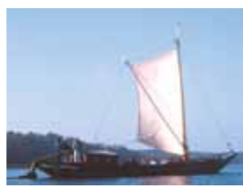
Bis zum Ausgang des 19. Jhs. war der Lastensegler mit seinen charakteristischen, hochgezogenen Bug- und Heckspitzen (Kaffen) als Transportmittel auf den Seen und Flüssen von Bedeutung. Heute kann der originalgetreue Nachbau für eine Erlebnistour auf den Spuren der traditionellen Binnenschifffahrt für bis zu 50 Personen gechartert werden. Ob beim Segeln, Treideln oder Staken, das Schifferhandwerk wird während einer Tagestour zwischen ehemaligen Schifferdörfern lebendig.

Wiesen und Felder soweit das Auge reicht – Weite empfängt den Wanderer auf seinem Weg durch die sanft geschwungene Endmoränenlandschaft bis Steinförde. Wahrscheinlich der günstigsten Lage an einer Havelfurt ist die Gründung dieses Ortes geschuldet. Heute ist Steinförde ein beschauliches Ausflugsziel mit ganz dem Naturerleben verpflichteten Freizeitangeboten.