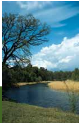
Die Betreiber der ehemaligen Glashütte nahe dem heutigen Wasserwander-Rastplatz an der Brücke in Steinförde mögen um 1800 die Nähe zur schiffbaren Havel für den Transport ihrer Waren gesucht haben.