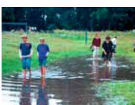
Der „Umweltbahnhof Dannenwalde“ avancierte zum Ausgangspunkt einer sozial- und umweltverträglichen Freizeit-Mobilität. Auf dem Barfußpfad Dannenwalde mit einer Freiluftausstellung werden die Besucher auf gefordert, sich ihrer Schuhe zu entledigen.