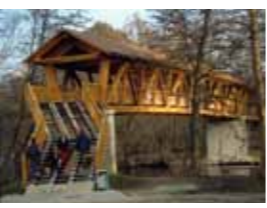
Die Fachwerk-Holzbrücke aus wetterfester Douglasie und Eichenbohlen gewährt einen beschaulichen Blick auf Schwedt- und Baalen-see.