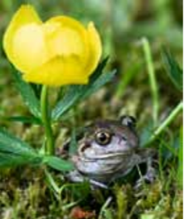
Trollblume und Knoblauchkröte

Wahrscheinlich nach einer Grasart (Segge) benannt, ziehen sich die Siggelwiesen bis zum Ufer des gleichnamigen Havelabschnitts. Zwischen Mai und Juli reckt die geschützte Trollblume ihre kugelig geschlossene Blüte aus dem feuchten Wiesengrund. Das gelbe Hahnenfußgewächs ist schwach giftig und öffnet nur bei starker Sonnenbestrahlung seine zarten Blüten ein wenig.