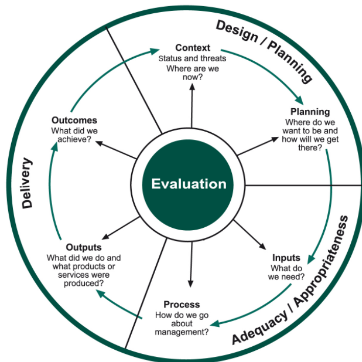
Abbildung 1: Rahmenkonzept zur Bewertung der Managementeffektivität von Schutzgebieten (aus HOCKINGS et al. 2006)

In Auswertung dieser Arbeitsgrundlagen – der intensiven Lektüre des Fragebogens und des „Büroberichts“ – bereitet sich das Komitee schließlich zielgerichtet auf die Bereisung des jeweiligen Nationalparks vor.