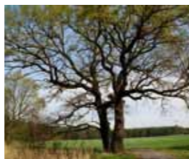
Der Lieracksteich leidet noch unter großflächiger Grundwasserabsenkung – die alten Eichen am Rand ebenso.

Die Gewässer bieten zahlreichen Tierarten wertvolle Lebensräume. Sie sind Laichplätze für die seltenen Rotbauchunken und Laubfrösche, die im Frühjahr grandiose Konzerte geben. Dann trompeten oft auch die Kraniche, sie brüten im Röhricht. Fischotter, Fisch- und Seeadler kommen regelmäßig zur Nahrungssuche. Der größte Teich am Wanderweg ist der „Große Paul“. Dieser war schon 1933 im ersten Verzeichnis der Naturdenkmäler der Provinz Brandenburg als „besonders schützenswertes Naturdenkmal“ eingetragen. Von 1987 bis 1993 fielen seine Zuflüsse – die Luckaitz – und damit auch der Große und der Kleine Paul sowie weitere Bereiche vollkommen trocken. Grund dafür war die Grundwasserabsenkung zur Kohleförderung im nahe gelegenen Braunkohlentagebau Greifenhain, östlich von Altdöbern. Da die anderen Teiche weiterhin durch den Weißäger Bach gespeist wurden, konnten die dort lebenden Tiere dorthin ausweichen. Somit ist die Buchwäldchener Teichlandschaft bis heute ein wichtiges Refugium in der vom Braunkohleabbau geprägten Region. Südöstlich des „Großen Pauls“ gab es bis in das 19. Jahrhundert hinein eine Siedlung. In alten Karten wie dem Urmesstischblatt von 1847 ist ein „Berlinchen“ zu finden, es wurde vermutlich durch Feuer zerstört. Den Teichen nahe der Ortschaft Muckwar mangelt es noch immer an Wasser. Zur Zeit der slawischen Besiedlung war dies ganz anders. Der slawische Ortsname verrät, dass es ein „Nasses Dorf“ war. Reste einer mächtigen Mauer entlang der Altdöberner