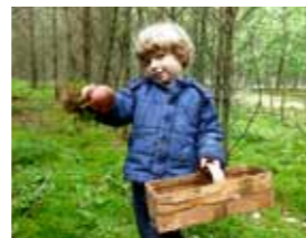
Die Region ist beliebtes Ziel von Pilzsammlern.

Während des zweiten Weltkrieges, brannten große Bestände der umliegenden Wälder nieder. Zum Aufforsten standen oft nur Kiefern zur Verfügung. Heute werden wieder mehr Laubbäume gepflanzt.