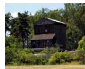
Für die Besichtigung der Windmühle Zwietow muss man sich anmelden. Tel. (03541) 802754