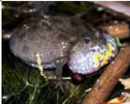
Zahlreiche Rotbauchunken leben in den Teichlandschaften.

Vom Bahnhof Luckaitztal ist es nur ein Katzensprung in das Naturschutzgebiet „Teichlandschaft Buchwäldchen-Muckwar“. Die Teiche wurden vermutlich im 12. Jahrhundert von Zisterziensermönchen zur Fischzucht angelegt und auch von den Gutsbetrieben Buchwäldchen und Muckwar genutzt. Heute zieht die Ökologische Teichwirtschaft Fürstlich Drehna hier Karpfen, um sie in der Fischerei in Drehna zu verarbeiten und zu verkaufen.