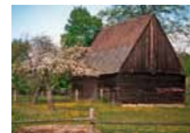
Die Schrotholzscheune aus mit der Schrottholzaxt behauenden Kiefernstämmen stand bis 1776 in Barzig. Das letzte Wohnblockhaus der Plinsdörfer steht heute im Freilichtmuseum Lehde im Spreewald.

Wer die Plinse nicht vorbestellt hat, kann die 45 Minuten, die der Hefeteig zum Gehen braucht, für einen Rundgang durch Weißag und Zwietow nutzen. Wie im deutsch-sorbischen Raum üblich, wurden in dieser Region Wohnhäuser und Ställe ursprünglich aus Holz gebaut und mit Stroh oder Schilf gedeckt. Davon zeugt die Schrotholzscheune in Zwietow. Als das Holz Ende des Mittelalters knapper und teurer wurde, besann man sich auf das Baumaterial, welches ringsum reichlich zu finden war: Feldsteine.