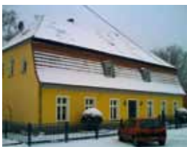
Das Buchwäldchener Gutsbaus ist heute in Privatbesitz (Dorfstr. 1).