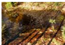
Wer genauer hinsieht, findet einen alten Schacht der Grube „Marie“.

Landstraße und eine Feldstein-Scheune erinnern an das zwischen 1000 und 1200 hier entstandene Rittergut. Das Gutshaus selbst liegt versteckt und ist Wohnhaus. Die Gaststätten im Ort bieten Gelegenheit sich zu stärken, um dann vorbei am sommer-trockenen Lieracksteich auf die sandigen Ausläufer der Calauer Schweiz zuzuwandern. Von der Landstraße bis zum Waldrand folgt der Weg der Trasse der einstigen „Klingelbahn“. Diese Schmalspurbahn brachte die fertigen Ziegel von der Ziegelei nördlich von Muckwar zum Bahnhof Luckaitztal, wo sie verladen und in alle Welt transportiert wurden. Unter der Calauer Schweiz lagern mächtige Flaschenton-Schichten. Dieses wasserundurchlässige Material sorgt für den Quellen-Reichtum. Der Ton wurde in kleinen Gruben gewonnen und diente den Töpfereien in Muckwar, Buchwäldchen und Altdöbern als Rohstoff für Flaschen, Krüge, Ofenkacheln und Ziegel. Auch Braunkohle lagert in der Tiefe, allerdings recht tief für den industriemäßigen Abbau. Nur an wenigen Stellen wurde für die Tuchfabrik in Werchow und für Ziegeleien zwischen 1850 und 1880 kurzzeitig Kohle gewonnen. So z.B. nördlich von Buchwäldchen. Ein kleiner Tümpel markiert die Lage der einstigen Grube „Marie“, wo 1851 bis 1853 untertage Braunkohle gefördert wurde. Ein von Obstgehölzen gesäumter Feldweg führt an einer ehemaligen Ziegelei vorbei hinab nach Buchwäldchen. Der sich auf dem Acker linkerhand gut abzeichnende Hügel wurde früher als Weinberg genutzt.