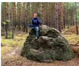
Der „Opferstein“ etwa 1 km südlich von Muckwar ist einer der wenigen am natürlichen Standort verbliebenen Findlinge der Niederlausitz. Manche nennen ihn Lutchenstein, nach dem sagenumwobenen Zwergenvolk der Niederlausitz.

Die Gewässer bieten zahlreichen Tierarten wertvolle Lebensräume. Sie sind Laichplätze für die seltenen Rotbauchunken und Laubfrösche, die im Frühjahr grandiose Konzerte geben. Dann trompeten oft auch die Kraniche, sie brüten im Röhricht. Fischotter, Fisch- und Seeadler kommen regelmäßig zur Nahrungssuche. Der größte Teich am Wanderweg ist der „Große Paul“. Dieser war schon 1933 im ersten Verzeichnis der Naturdenkmäler der Provinz Brandenburg als „besonders schützenswertes Naturdenkmal“ eingetragen. Von 1987 bis 1993 fielen seine Zuflüsse – die Luckaitz – und damit auch der Große und der Kleine Paul sowie weitere Bereiche vollkommen trocken. Grund dafür war die Grundwasserabsenkung zur Kohleförderung im nahe gelegenen Braunkohlentagebau Greifenhain, östlich von Altdöbern. Da die anderen Teiche weiterhin durch den Weißäger Bach gespeist wurden, konnten die dort lebenden Tiere dorthin ausweichen. Somit ist die Buchwäldchener Teichlandschaft bis heute ein wichtiges Refugium in der vom Braunkohleabbau geprägten Region. Südöstlich des „Großen Pauls“ gab es bis in das 19. Jahrhundert hinein eine Siedlung. In alten Karten wie dem Urmesstischblatt von 1847 ist ein „Berlinchen“ zu finden, es wurde vermutlich durch Feuer zerstört. Den Teichen nahe der Ortschaft Muckwar mangelt es noch immer an Wasser. Zur Zeit der slawischen Besiedlung war dies ganz anders. Der slawische Ortsname verrät, dass es ein „Nasses Dorf“ war. Reste einer mächtigen Mauer entlang der Altdöberner