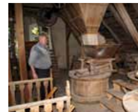
In der Alten Mühle wird noch heute Buchweizen vermahlen.

So entstanden auf engem Raum zahlreiche Wohnhäuser, Scheunen, Torhäuser und Mauern aus den kleinen Findlingen.