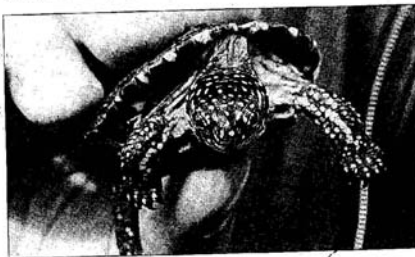
Eine junge Europäische Sumpfschildkröte. 20 Exemplare wurden jetzt in die Freiheit entlassen.

Neben den natürlichen Feinden – Wildschweine und Marderhunde plündern gern die Gelege der Schildkröten – spannen auch die Reptilien selbst ihre Forderer auf die Folter. „Sie werden erst mit 15 Jahren geschlechtsreif“, erklärt Breu. Trotzdem ist der 55-Jährige überzeugt, dass es in Mecklenburg mit den Schildkröten klappt. „Bis 1994 gab es hier sogar noch eine alte Population“, sagt Breu. Plötzlich waren damals allerdings die letzten vier bis sechs Tiere verschwunden. Ob sie Wildtieren in die Hände fielen, ist ungeklärt. Im Jahr 2000 wurde noch ein mehr als 60 Jahre altes Weibchen gefunden. Dies sei nach Linum gebracht worden – von wo aus jetzt einige Nachkommen zurückkehren.